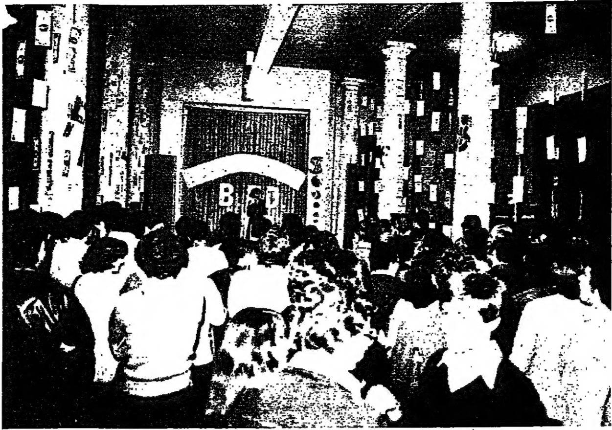
الاوراق التقنيّة تزين مكان الحفلة